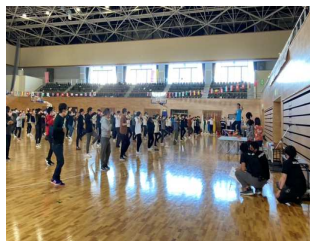
オータムフェスタと測定ブース

※3 ユトレヒト・ワーク・エンゲージメントの尺度の活力・熱意・没頭に関する設問17問(最低0点~6点で、高得点ほど良好な状態を表す)の平均点