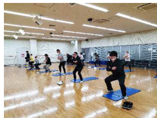
生活習慣病改善プロジェクト「健幸くらす」