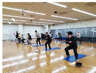
生活習慣病改善プロジェクト「健幸くらす」